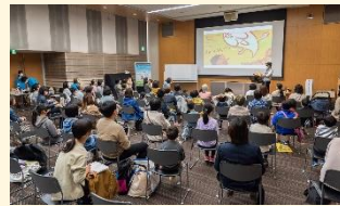
平和のイベントに初めて参加したという人で大盛況でした

平和に関する絵本の読み聞かせ、ウクレレの即興演奏、ワクワクする墨汁イラストなど、盛りだくさんの内容とおして、楽しみながら平和について考えることができました