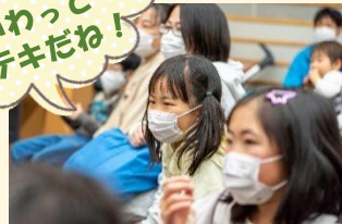
楽しい絵本の世界に子どもたちも夢中♪