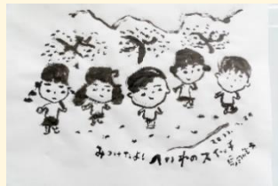
イベントに向けたイラストも描いていただきました