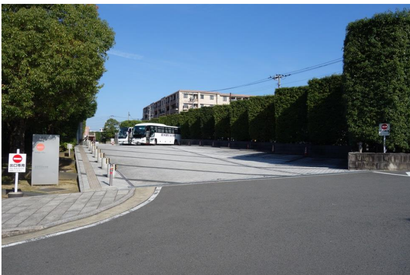
駐車場出口 H29. 12. 25~12. 28 H30. 1. 1~1. 3 この期間については、通常入口を交通中止にしますので、出口からの進入をお願いいたします。