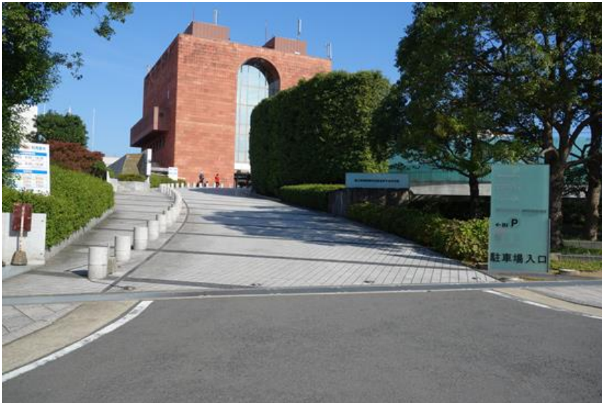
駐車場入口 H29. 12. 25~12. 28 H30. 1. 1~1. 3 上記期間交通中止