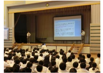
学校文化祭での報告