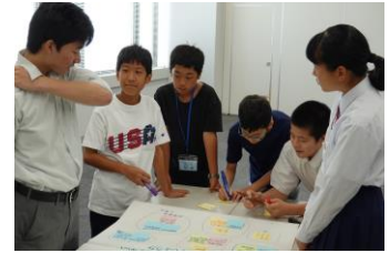
事前学習会の様子

事前研修会のグループワークで「戦争」や「平和とはどのような状態か」意見をまとめた模造紙を元に、集まった保護者や引率教諭へ発表を行いました。合わせて「派遣中どのようなことを学習したいか」一人一人が発表することで、派遣への思いをより深めることができました。