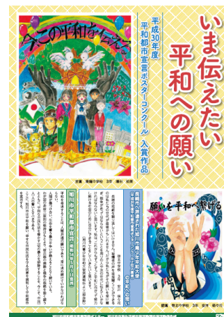
平和都市宣言啓発ポスター