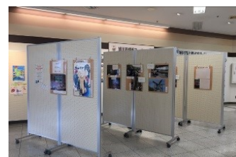
報告パネル展の様子