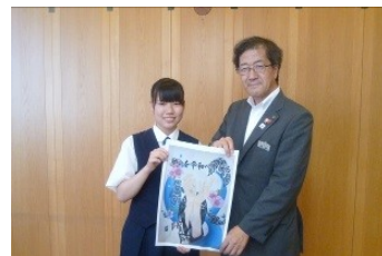
市長表敬訪問の様子