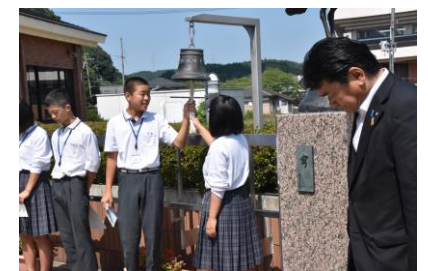
平和のつどい 鐘の音のもと黙祷