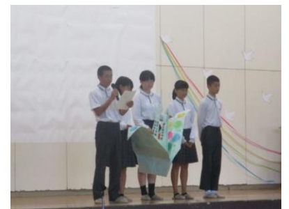
長崎市立桜馬場中学校の集会に参加