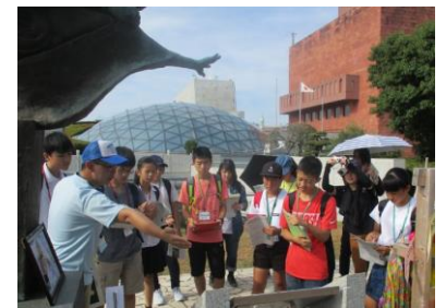
フィールドワーク