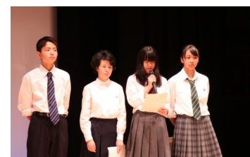
人権を考える市民のつどいの様子