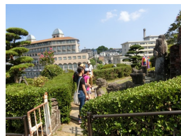
現地でのフィールドワーク