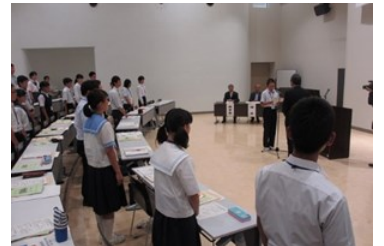
誓いの言葉を述べる派遣者