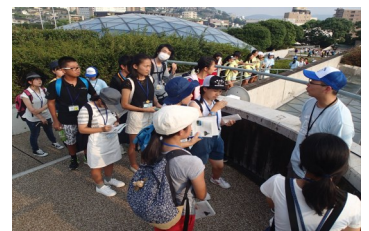
長崎平和学習の様子

【URL】 http://www.vill.kitanakagusuku.lg.jp/site/view/contview.jsp?cateid=11&id=1922&page=1