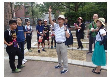
長崎平和学習の様子

長崎で学んだ事を学校に帰ったら友達や周りの方達に広めて、また平和についてみんなで考えて下さい。