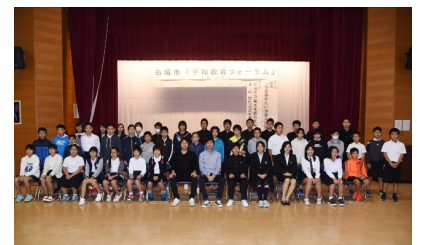
平和教育フォーラム

・世界平和の鐘の会沖縄県支部が主催する、「終戦記念世界平和の鐘打式」へ参加してきました。派遣後も平和への思いは途切れることなく継続しています。