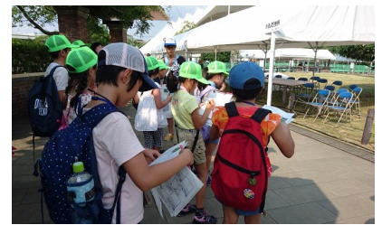
ピースフォーラムでのフィールドワーク

長崎で見て感じたことを一生忘れてはいけないと思いました。この体験を色々な人たちに伝えていきたいと思いました。