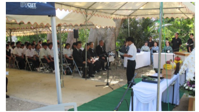
平和祈念式・作文朗読

・石垣市主催による慰霊の日式典に参加して頂きました。式典において作文入賞者は、朗読を行いました。また、式典会場には「平和を考える作文・絵画」入賞作品の展示も行いました。