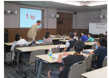
事前学習会の様子