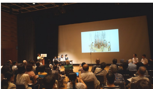
「ふりそでの少女」を紹介