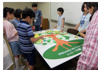
オリエンテーション

・平和公園、城山小学校などを2時間かけて歩いて巡りました。 ・原爆資料館にて千羽鶴の献呈後、展示室の見学も行いました。