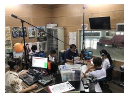
ラジオ収録の様子