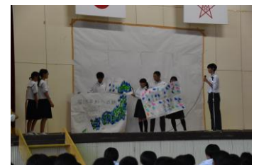
長崎市立桜馬場中学校の集会に参加

・私たちの使命は、このピースフォーラムに参加して自分の考えを深めることだけではなく、この学習を通して感じたこと、思ったことを、一人でも多くの人に伝えていき、戦争のない、誰もが平和だと感じられる未来を作っていくことです。