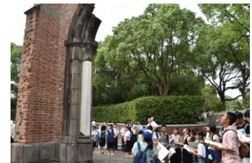
被爆地を巡る特使