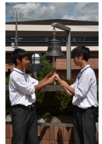
平和のつどい 平和の鐘を鳴らす