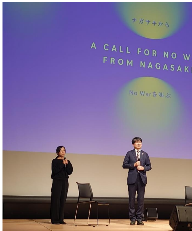
「神父とシスターと爆弾」